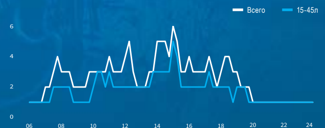
Среднее число слушателей по рабочим дням (AQH, в тысячах)