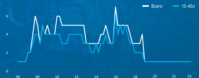
Среднее число слушателей по рабочим дням (AQH, в тысячах)